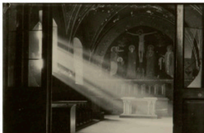
Josef Sudek: Inneres einer Kapelle . 1945