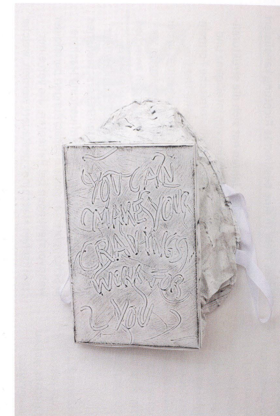
Lilli Thießen container/OLDS , 2015 Ausstellungsansicht in awe , Kunsthalle Exnergasse, Wien