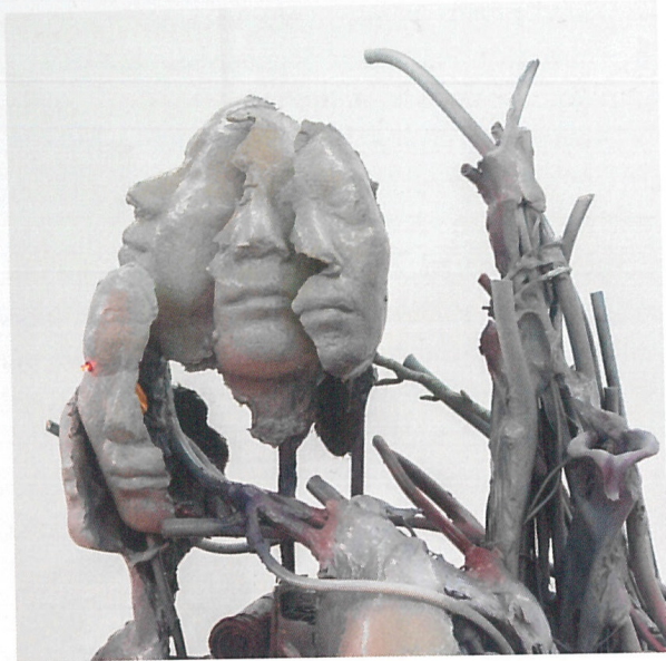
Yein Lee devouring chaos – growth of reconstructed time, overflowing bodies, and static electricity, Detail, 2022 Installationsansicht, Loggia, München, 2022