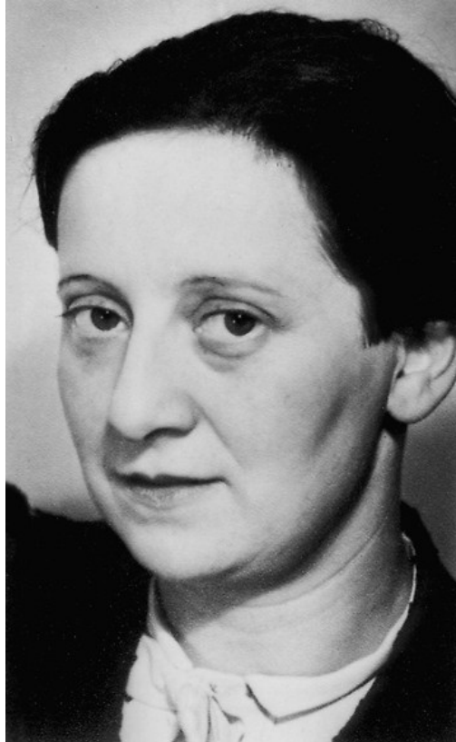
Friedl Dicker-Brandeis (1898–1944) schuf ein vielfältiges Werk mit Zeichnungen, Gemälden, Fotocollagen, Filmausschnitten, Webmuster sowie Möbel- und Architektorentwürfen

1931 wurde die engagierte Kommunistin, die auch Propagandaplakate für die Partei sowie Schwarz-Weiß-Collagen entwarf, wegen Passfälschung verhaftet. Die Erlebnisse im Gefängnis verarbeitete sie in ihrer wohl wichtigsten, verstörenden Gemäldeserie „Das Verhör“ (1934/35). Die politischen Umstände zwangen sie zur Emigration nach Prag und ins nordböhmischen Hronov, wo sie psychologisch tiefgründige Porträts und Landschaften im Stil der Neuen Sachlichkeit malte und erstmals – inspiriert von ihren früheren Lehrern – auch Kinder unterrichtete.