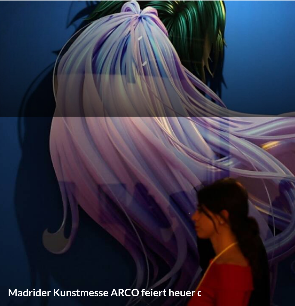
Madri der Kunstmesse ARCO feiert heuer c