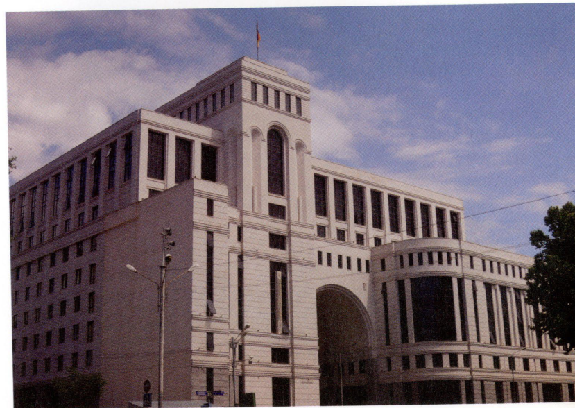
Neues Regierungsgebäude in Jerewan