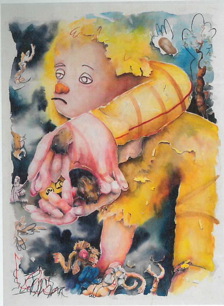
Beth Frey, Cuddling roos of boughz , 2023 Aquarell auf Papier, Courtesy: Beth Frey