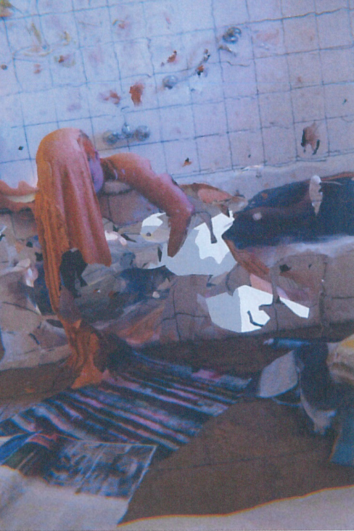
Tina Kult Power & Sleep , 2022 © Tina Kult