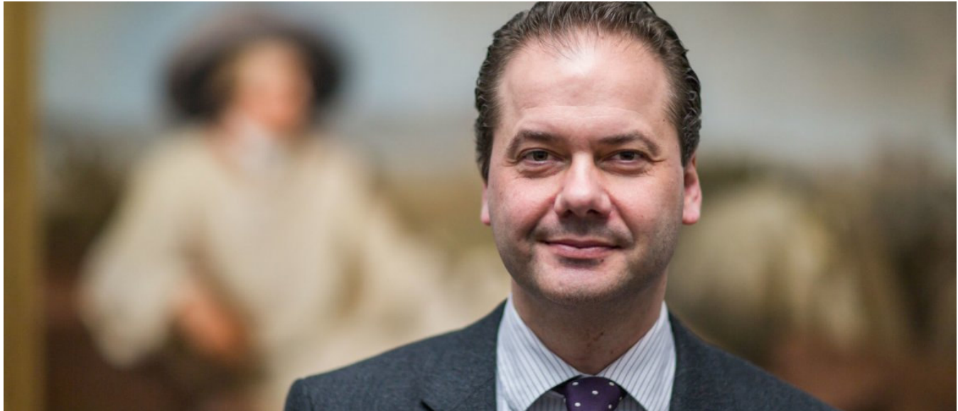
Max Hollein vor dem nächsten Karriereschritt in New York.

vom 04.08.2022, 10:00 Uhr | Update: 04.08.2022, 10:05 Uhr