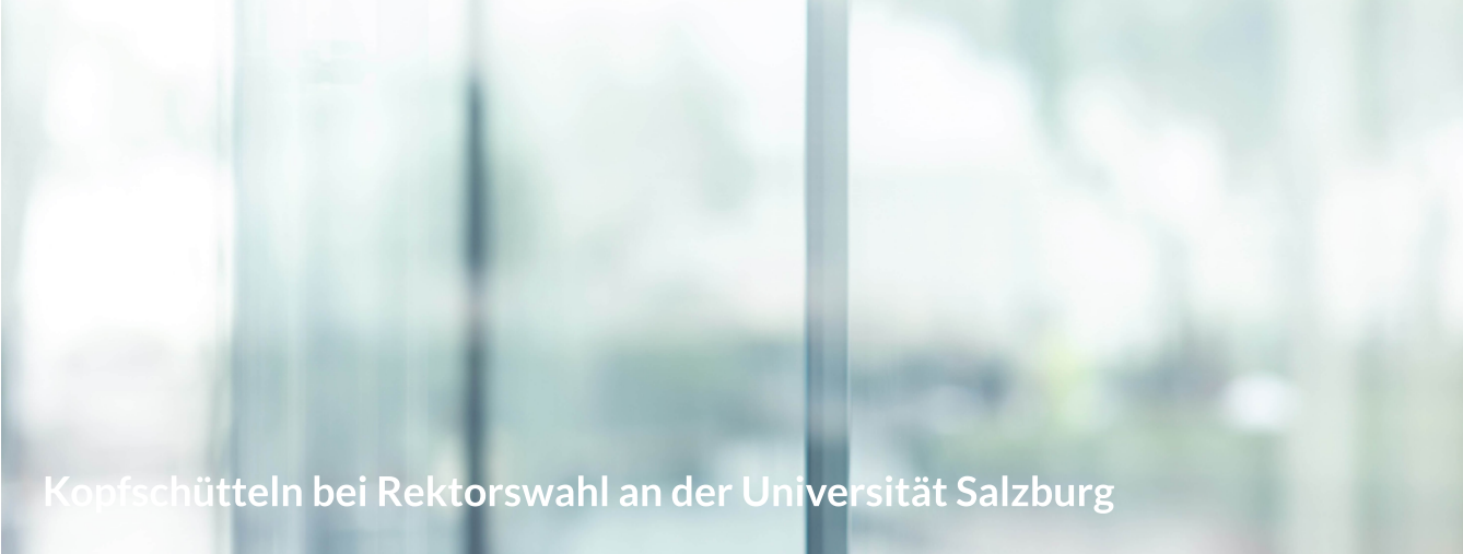
Kopfschütteln bei Rektorswahl an der Universität Salzburg