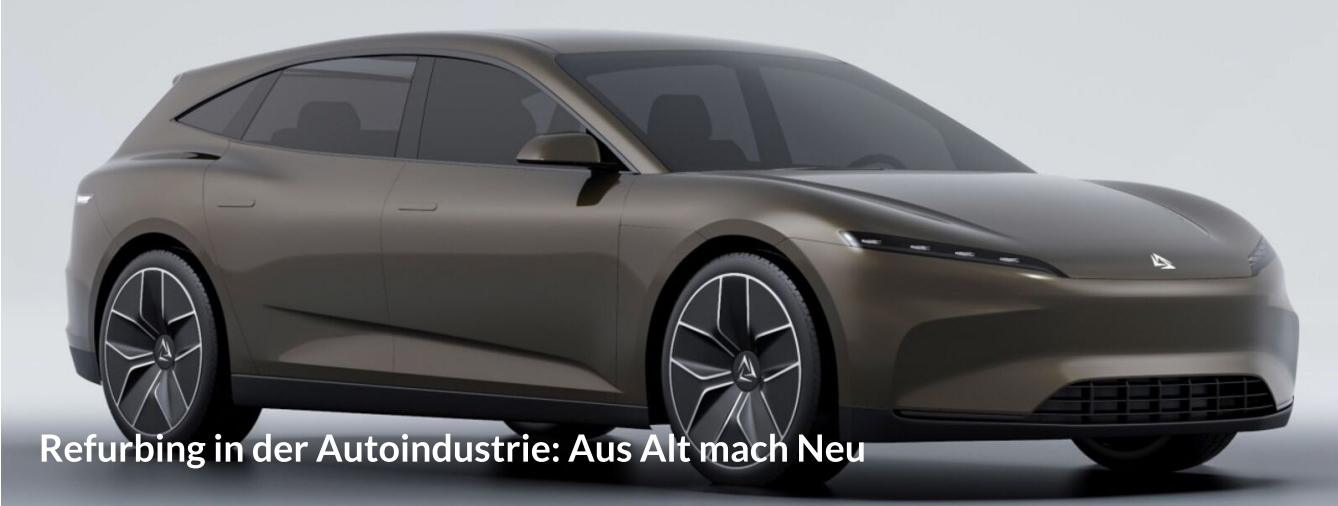
Refurbing in der Autoindustrie: Aus Alt mach Neu