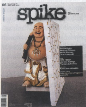
Coversujet RACHEL HARRISON Buddha with Wall , 2004 Holz, Polyester, Styropor, Zement, Acryl und Fiberglas/wood, polystyrene, cement, acrylic and fiberglass 203 x 208 x 101 cm