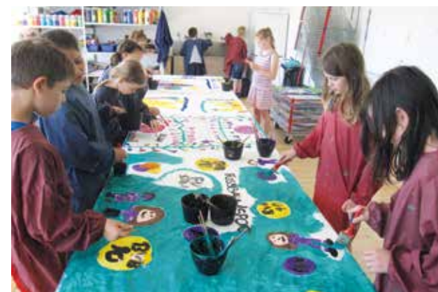
GTVS Schumpeterweg, Wien