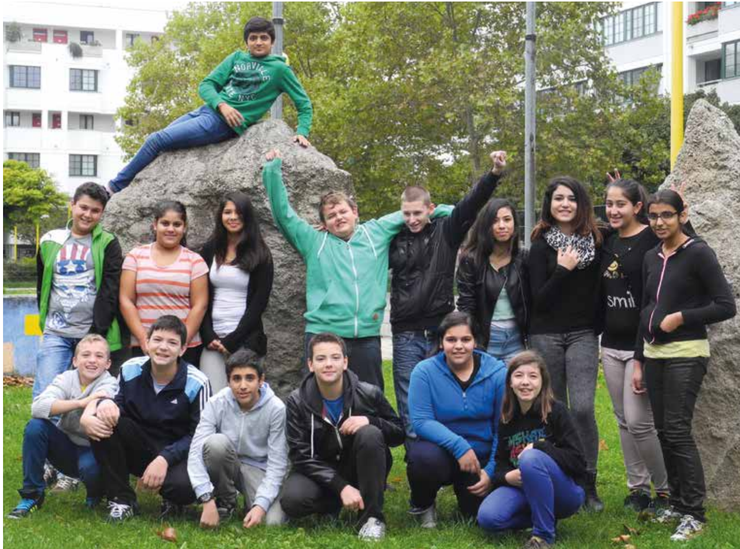
NMS Am Schöpfwerk, Wien