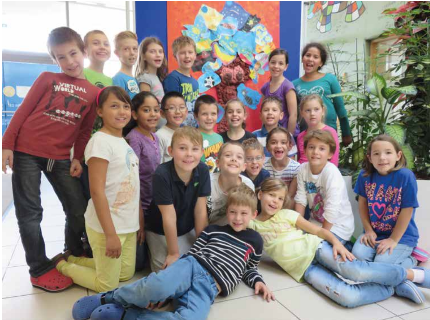
GTVS Schumpeterweg, Wien