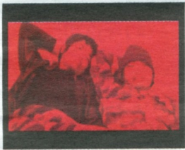
A. Weerasethakul • Haiku