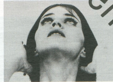
J. Leth • The Perfect Human

Subscribe to your online documentary cinema for only 5 euro a month!