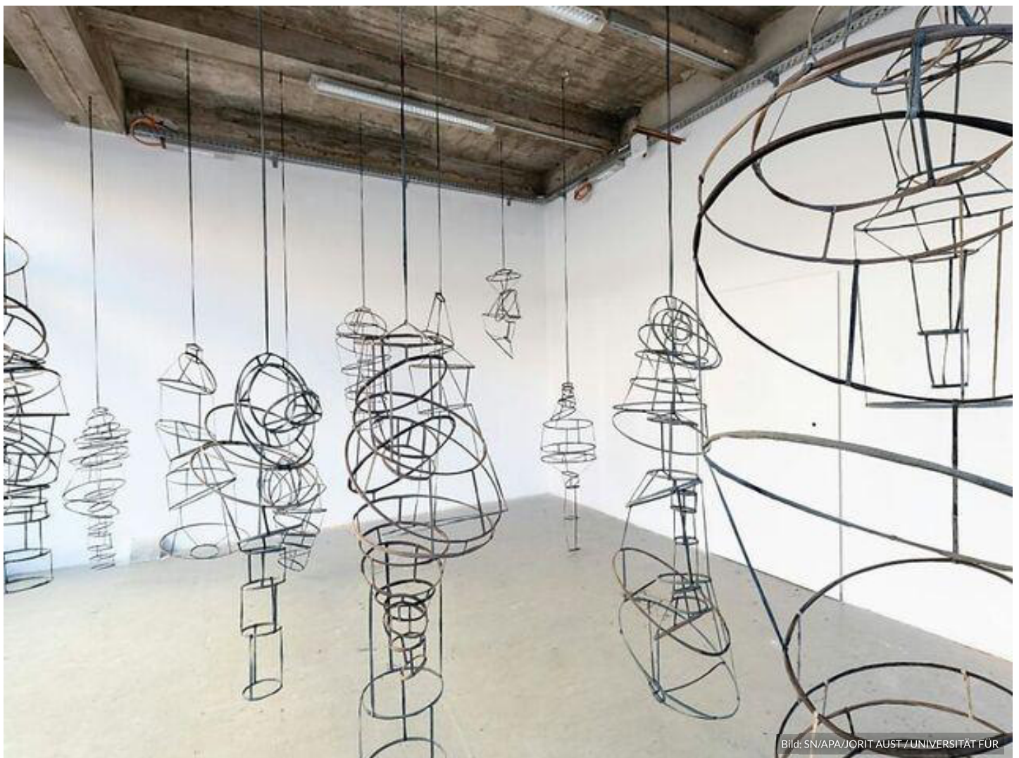
Sara Ghalandari: "Circle as space", Ausstellungsansicht