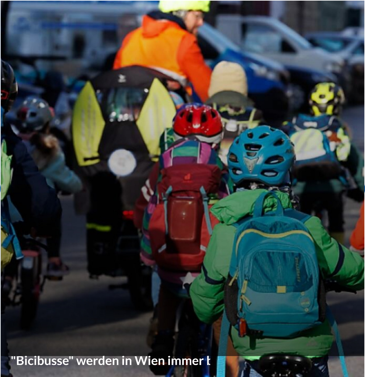
"Bicibusse" werden in Wien immer t