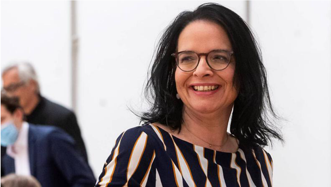
Die neue Kultur-Staatssekretärin Andrea Mayer