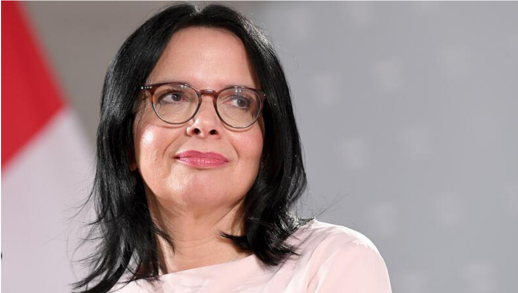
Staatssekretärin Andrea Mayer

Von nachrichten.at/apa 28. Mai 2020 12:39 Uhr