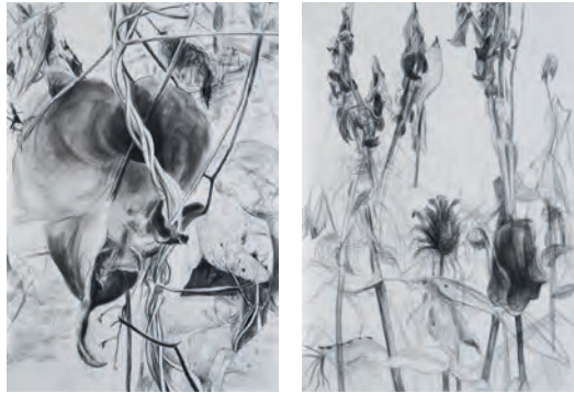
rechts / right Gartenbilder Kreide auf Leinwand/ chalk on canvas 200 x 140 cm, 2016