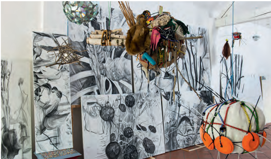
unten / down Atelieransicht 2016