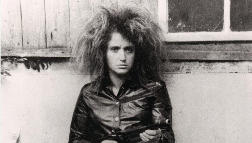
VALIE EXPORTS „Aktionshose: Genitalpanik“ (1969)

Von Peter Grubmüller 30. September 2020 00:04 Uhr