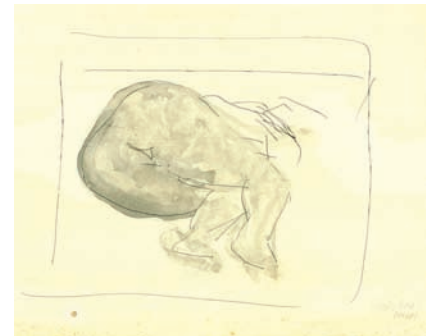
Heliane Wiesauer-Reiterer Grauer Akt , 1967/2003 28,7 x 35,5 cm Tusche, Graphit auf Papier