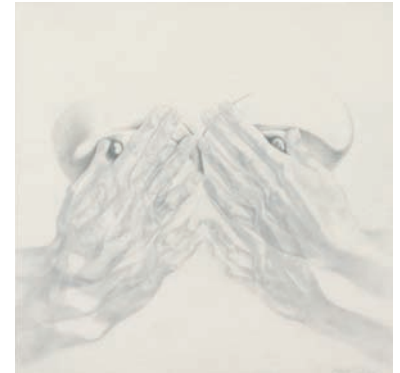
Juliana Do Nude II , 2006 40 x 40 cm Graphit auf Transparentpapier

Vielleicht oder wahrscheinlich erzählen Künstlerinnen erotische Geschichten über und für Frauen, während Künstler eher mittels Frauen die Männer ganz gern voyeurisieren.