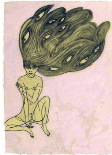
Anna Stangl Augenhaar , 2007 42 x 30 cm Ölpastell, Graphit, Kohle, Kreide auf Papier