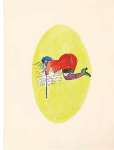
Petra Maitz Ohne Titel, 2003 48 x 36 cm Kohle, Aquarell auf Zeichenkarton

Gesche Heumann Ohne Titel, 2008 70 x 100 cm Kohle auf Papier