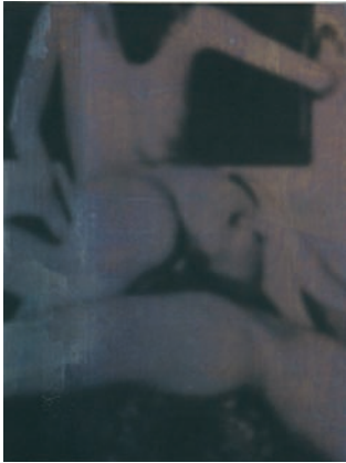
Eva Schlegel Ohne Titel, 2008 40 x 30 cm Siebdruck auf Blei

Titelseite: Tina Dietz Damenanderdecke I, 2008, 66 x 100 cm Fine art pigment print auf Büttlen