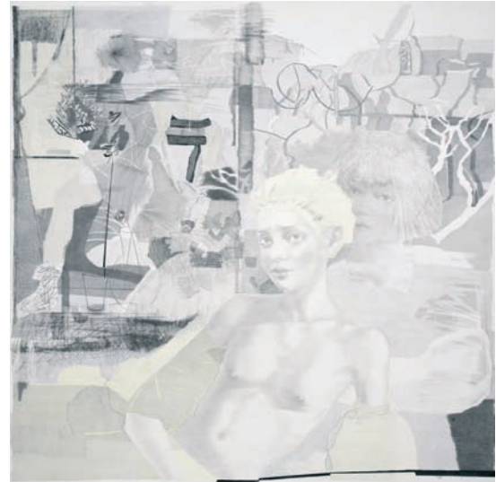
Sevda Chkoutova Verblüht , 2008 150 x 150 cm, Graphit, Kreide, Buntstift auf Papier