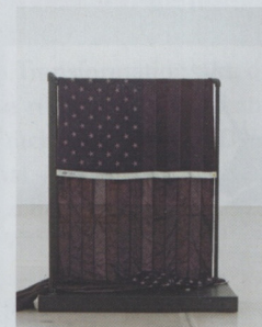
Cover: TOM BURR Black Dye, 2007

Die nächste Ausgabe von spike erscheint am 27. März 2009 / The next issue of spike will be out on March 27, 2009