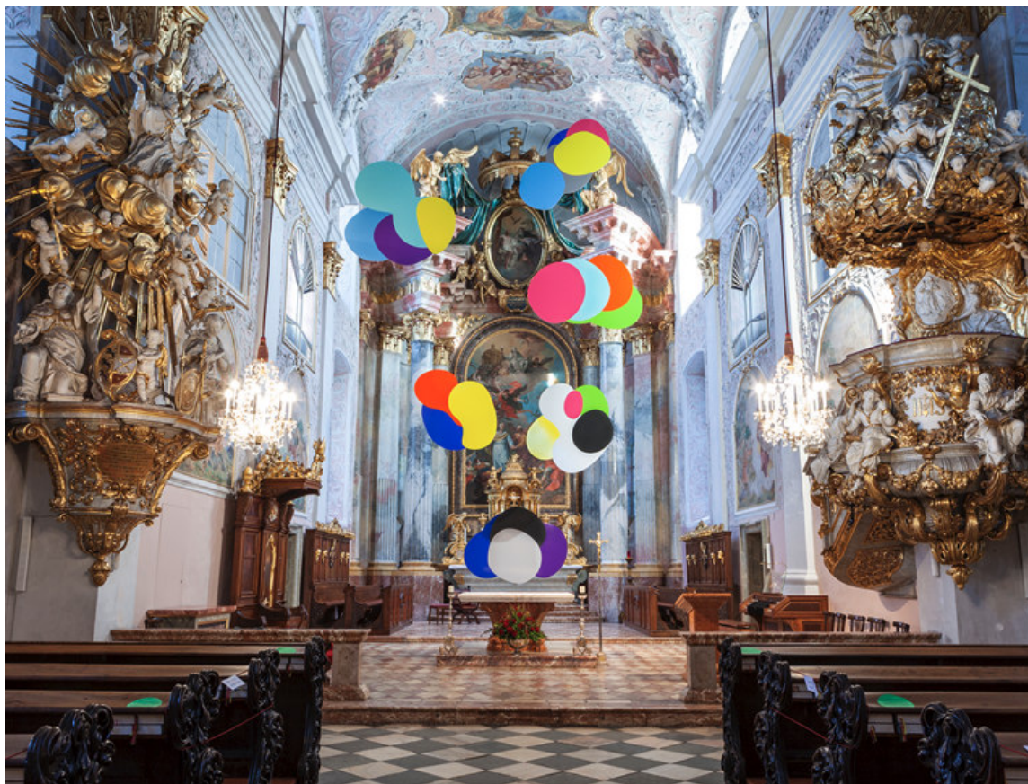
"Bokeh ", Experimentelles Fastentuch im Klagenfurter Dom, 2021

Darüber hinaus arbeiten Hanakam & Schuller sich an Sehgewohnheiten ab und bringen digitale Ästhetiken auch mal in einen Kirchenraum. Kürzlich hing im Klagenfurter Dom eine Fastentuch-Installation, die mit dem Phänomen der optischen Unschärfe spielt und auf Bildern wie eine Fotomontage aussieht. Eine faszinierende Arbeit, bei der man den eigenen Augen nicht traut.