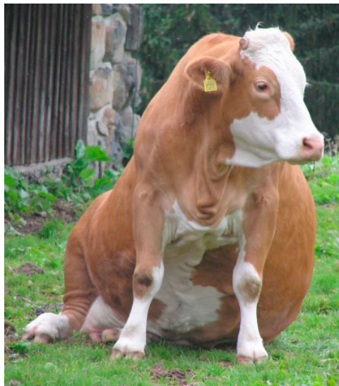
Liesel, 4 Jahre alt