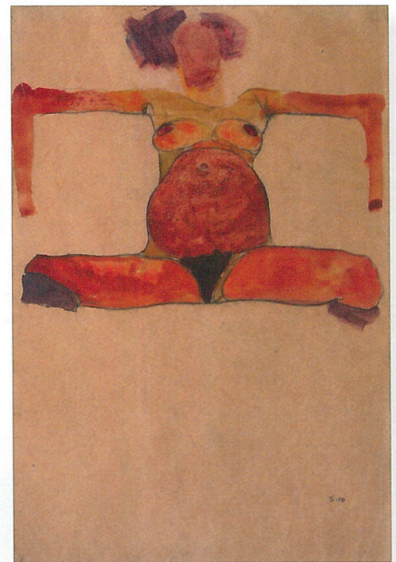
Titelbild: Egon Schiele, 1890 – 1918 Sitzender schwangerer Akt mit gespreizten Armen und Beinen, Aquarell und schwarze Kreide auf Papier, 44,8 x 31,1 cm Galerie Kaiblinger - Wien Seite 14 - 20