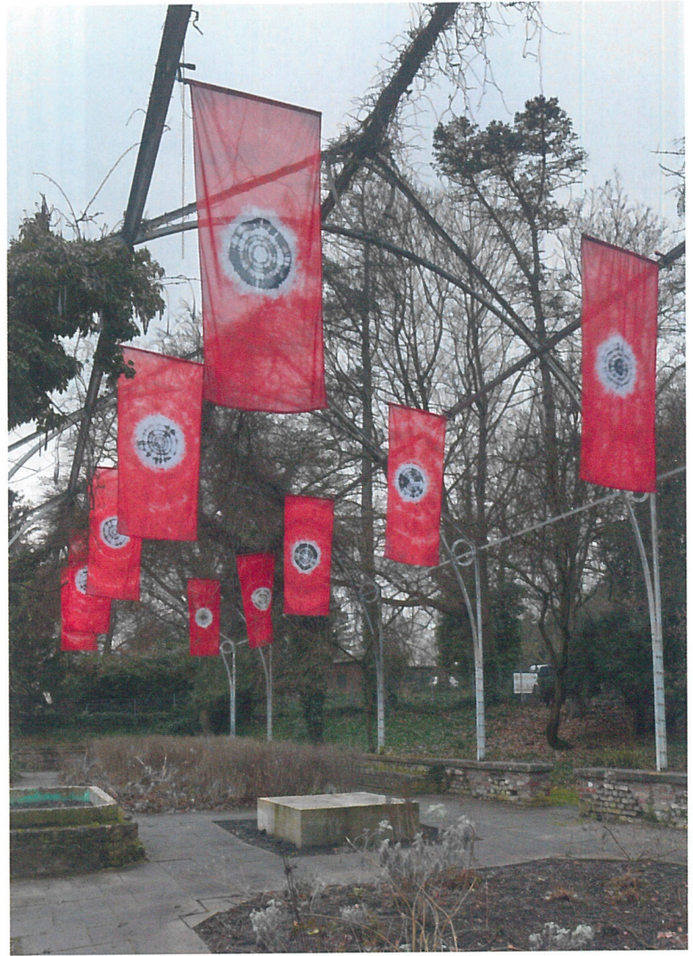
Frankfurter Hauptschule, kANzELKULTuR , 2022, Installation im Garten des Aachener Kunstvereins