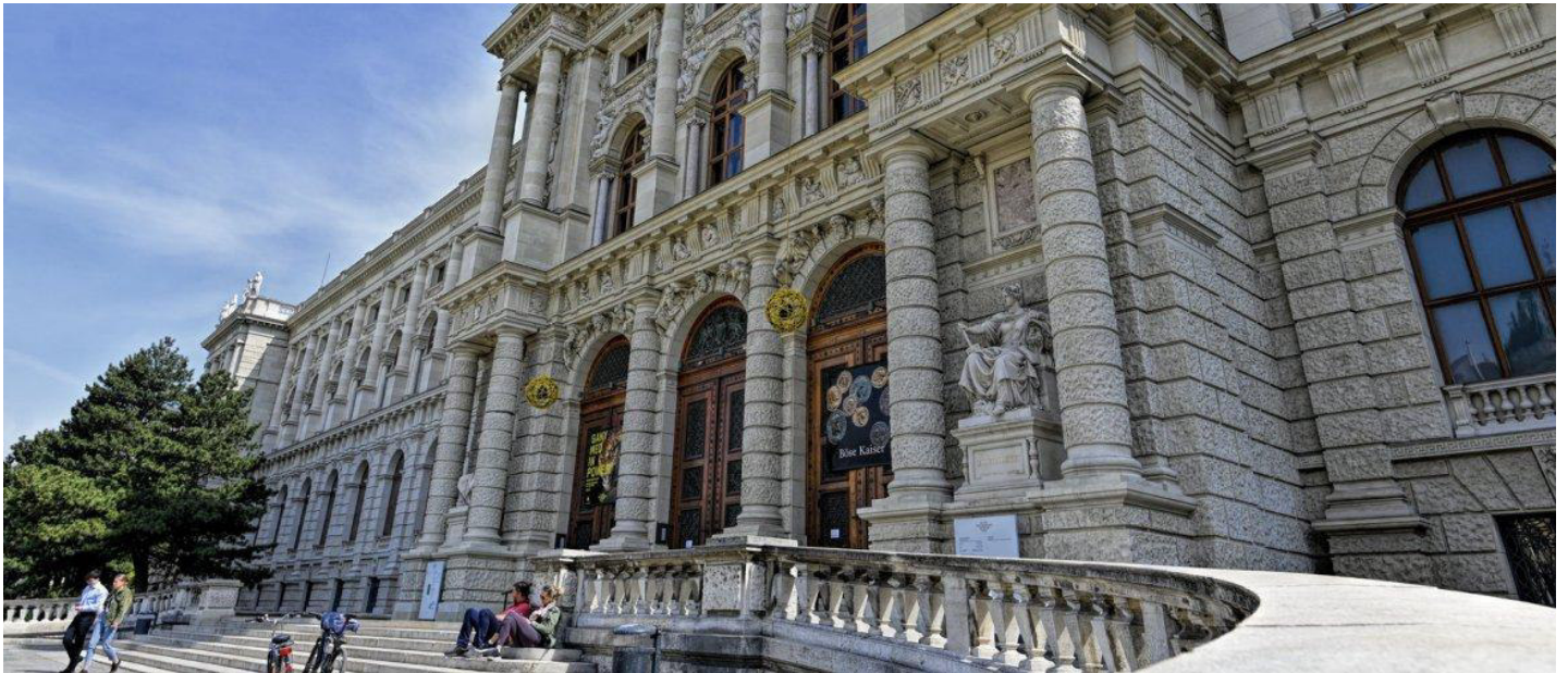
Das Kunsthistorische Museum sucht Besucher, die ihre Erfahrungen mitteilen.

vom 28.04.2021, 13:56 Uhr | Update: 28.04.2021, 14:03 Uhr