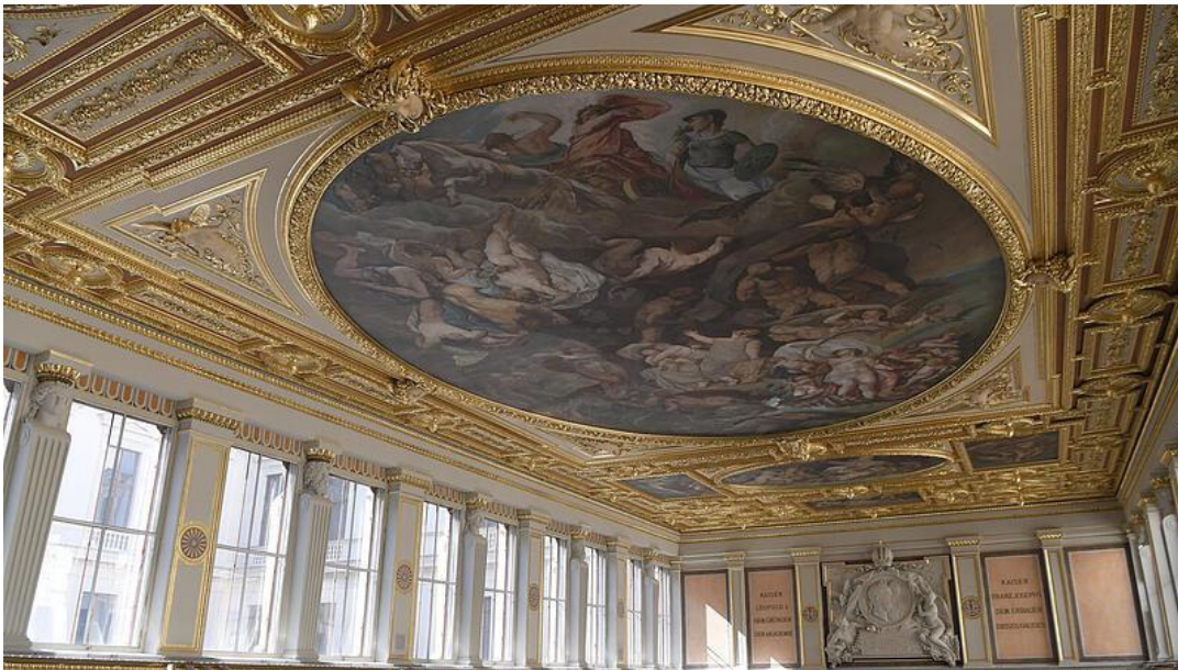
Deckenfresken in der Aula

Faßmann. Noch viel mehr Geld wurde und wird insgesamt in bauliche Maßnahmen für universitäre Einrichtungen investiert. In den vergangenen Jahren wurden dabei über die Bundesimmobiliengesellschaft 1,5 Milliarden Euro verbaut, für die kommenden Jahre sind weitere 1,6 Milliarden Euro bereits verplant. Und auch die Akademie der bildenden Künste hat weitere Baupläne: Zwei Institute (das Institut für Naturwissenschaften und Technologie in der Kunst und das Institut für Konservierung – Restaurierung) bleiben vorläufig im Ausweichquartier in der Augasse, dessen sonstige Auflösung im August beginnt, und sollen später ein neues Quartier erhalten, in dem es auch Werkstätten- und Ausstellungsflächen geben soll.