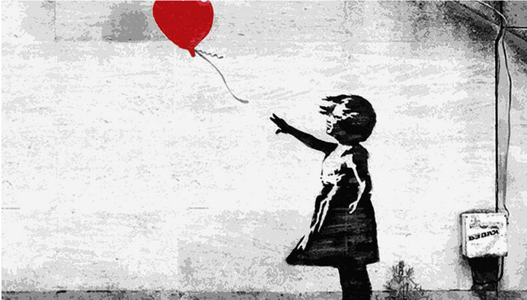
Banksys "Girl with Balloon"

Seine Arbeiten sind Ikonen der Street Art, aber ihn kennt niemand: Banksy.