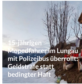
15-jährigen Mopedfahrer im Lungau mit Polizeibus überrollt: Geldstrafe statt bedingter Haft